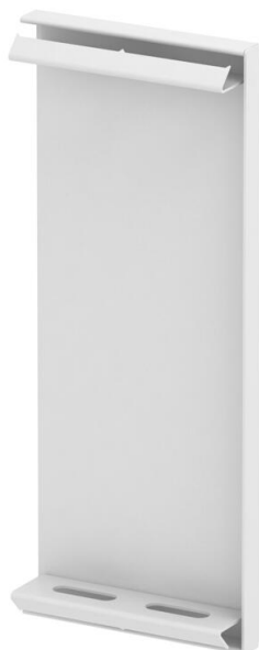
Elemento terminale per canale incasso apparecchi GS.