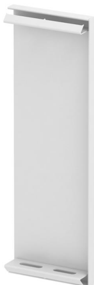
Embout pour goulotte d'appareillages GS.