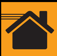
Avec alimentation aérienne