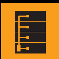
Tableaux général et secondaires